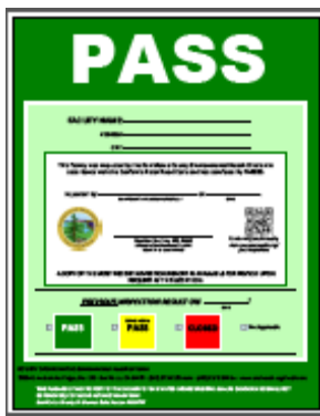
綠色牌 (Green placard)

餐館食肆在例行檢查期間不能有超過一個的嚴重違規。嚴重違規項目必需在檢查員離開前立即糾正。