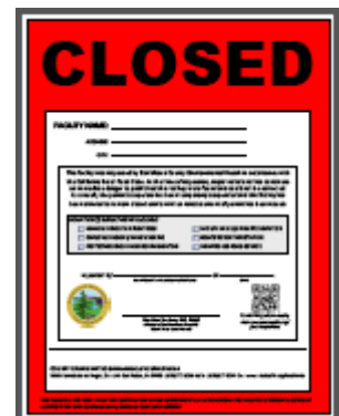
紅色牌 (Red placard)

餐館食肆在例行檢查期間有兩個以上的嚴重違規。嚴重違規項目必需在檢查員離開前立即糾正。檢查人員會在三天之內回來重新檢查。